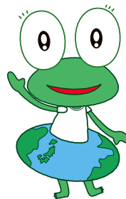
環境カエルの けろにい